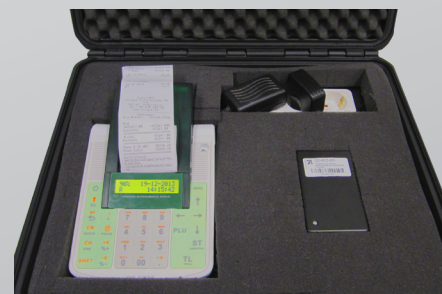
CleanBox50 komplett kassaregisterlösning

Om en batteridrivna CleanCash® kontrollenhet behöver transporteras och användas i besvärliga miljöer, finns en specialanpassad väska att tillgå, där plats för kontrollenheten, CleanAcc-batteriet, samt en genomgående kabelpassage ordnats. Väskan skyddar lösningen vid drift i besvärliga miljöer med låg temperatur, fukt och vatten, snö m.m.